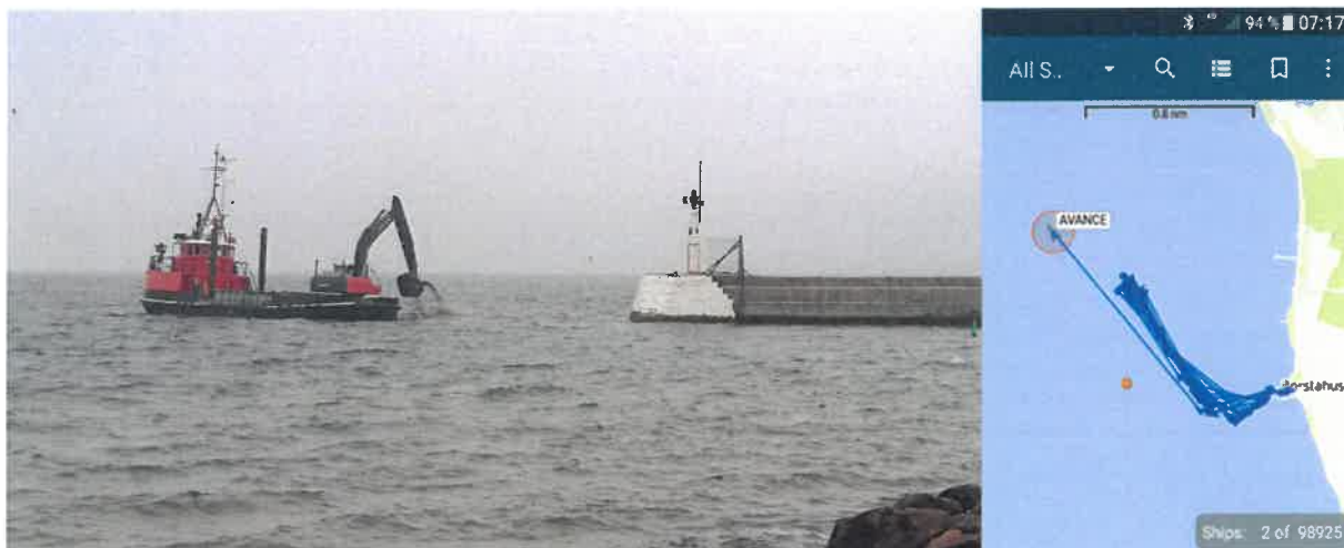
Mudderverket "Avance" rensar upp 1795 m 3 i hamninloppet i Borstahusen, 2-3 mars 2019.